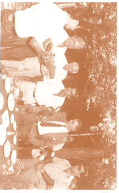
Un jugador de la A.D.C. hace entrega al Sr. Presidente y miembros de la Junta Directiva del testimonio de agradecimiento, una placa conmemorativa del acto.

El esfuerzo de los chicos no puede, no debe quedar marginado y por tanto habrá que pensar en ello. ¿Que tal un acto con una comida de hermandad? Vale. Y a ser campeones, que está "chupao".